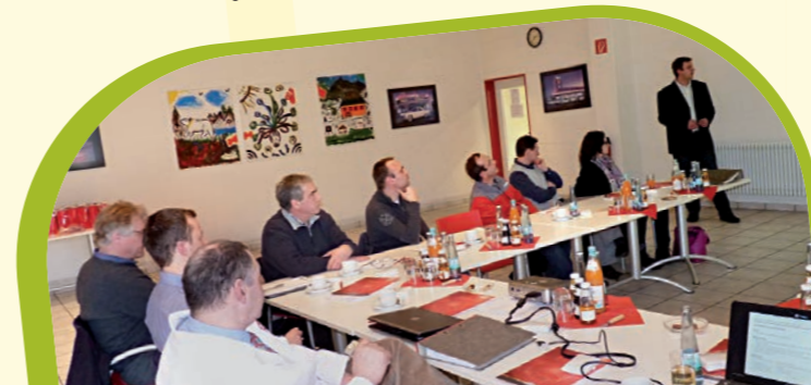
Bild: Teilnehmer des EMAS-Konvois 2012 mit Hotels und Gaststätten aus dem Naturpark Südschwarzwald mit Umweltminister Franz Untersteller.