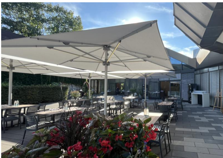
Abbildung 5: Sonnenschirme auf dem Vorplatz des Panoramasaals