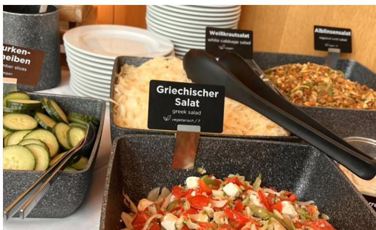
Abbildung 6: Buffetschilder