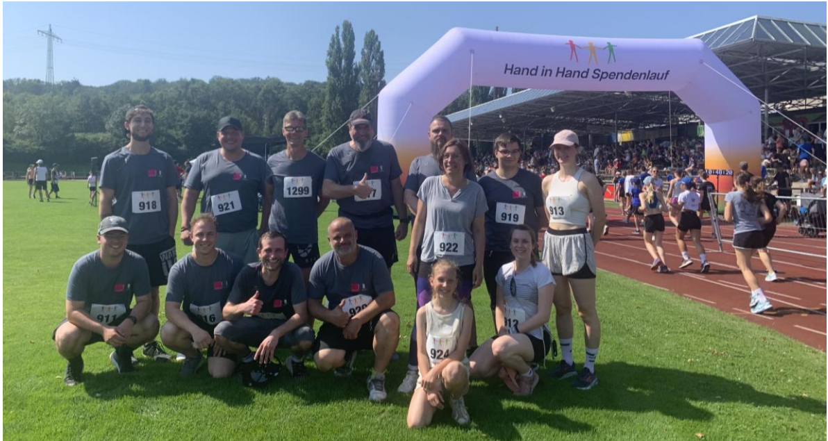
Abbildung 7: 12. Hand-in-Hand-Spendenlauf