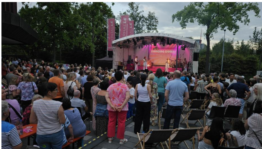
Abbildung 3: Kultur am Park am 26.07.2024