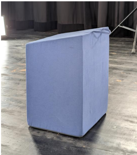
Abbildung 9: ergonomische Sitzhocker