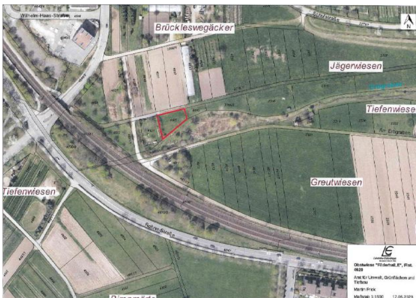
Abbildung 10: Lageplan der Streuobstwiese

Das Angebot des Produzenten, Apfelschorle in 0,5l Glasflaschen, wurde in unser Sortiment aufgenommen.