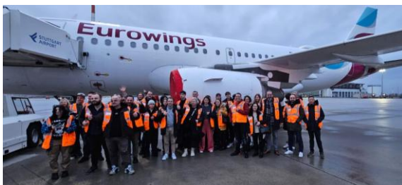
Abbildung 8: Betriebsausflug zum Flughafen Stuttgart