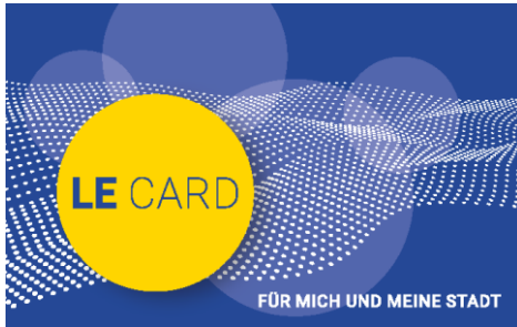
Abbildung 4: LE-Card