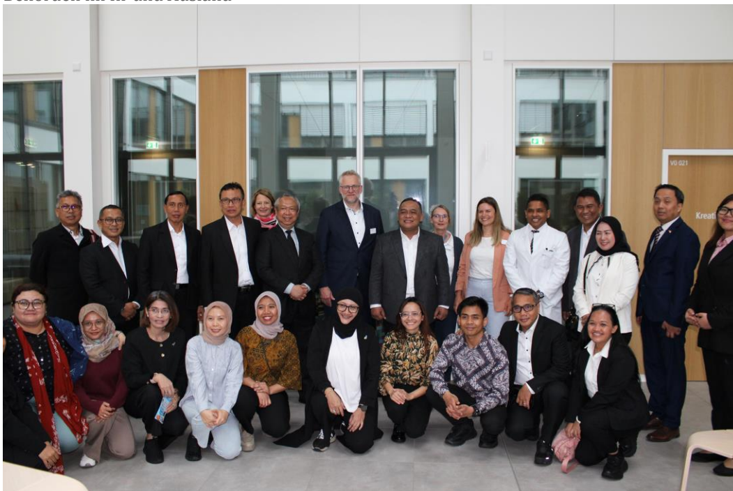
Bei dem Besuch einer Delegation aus Indonesien wurden die guten Arbeits-, Lern- und Wohnbedingungen der indonesischen Pflegekräfte bestätigt.