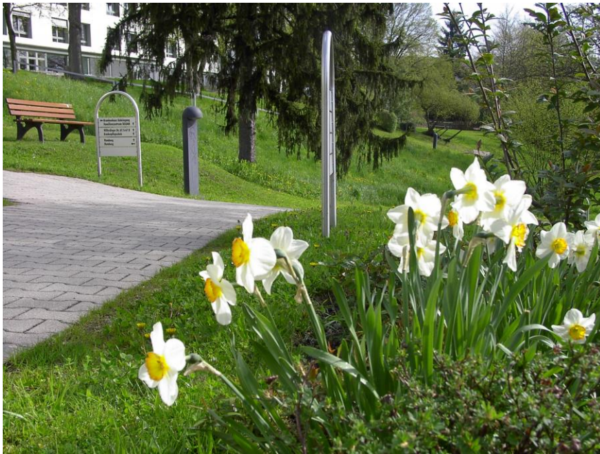
Ansicht aus dem Park des Siloah St. Trudpert Klinikums