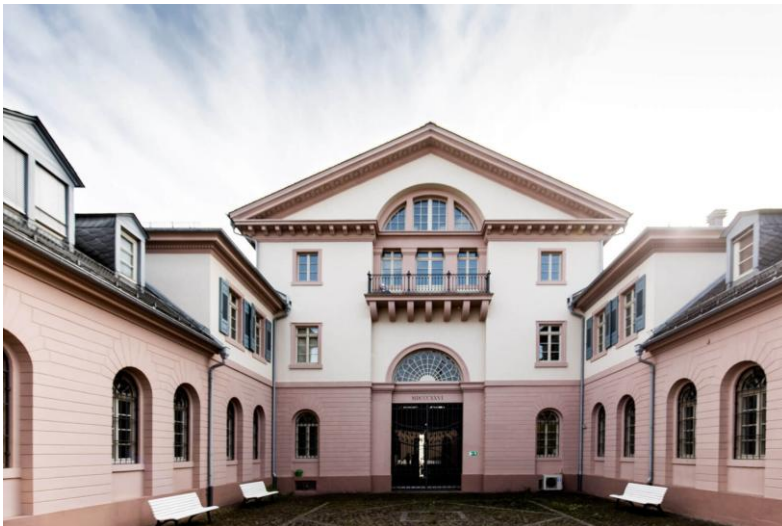
Bild: Standort Karlsruhe, Staatliche Münzen Baden - Württemberg, Copyright

Gegenstand des Landesbetriebs Staatliche Münzen Baden-Württemberg (SMBW) ist das Prägen von Münzen und Medaillen, die Herstellung von Dienstsiegeln, die Herstellung entsprechender Werkzeuge und der Vertrieb dieser Erzeugnisse. Das Unternehmen umfasst zwei Münzstätten. Die Münzstätte in Stuttgart mit 60 Mitarbeitern (Münzprivileg seit 1374) und die Münzstätte in Karlsruhe mit 20 Mitarbeitern (Münzprivileg seit 1362) arbeiten seit 1998 unter dem Namen „Staatliche Münzen Baden-Württemberg“ (SMBW) zusammen. Die SMBW sind für die Herstellung von 38 Prozent der deutschen Umlaufmünzen, 40 Prozent der deutschen Sammler- und Gedenkmünzen sowie für ein vielfältiges Medail- lenprogramm verantwortlich. Durch ihre innovative Produktionstechnik haben die SMBW auch interna- tional ein hohes Ansehen erworben. So gelten die Produkte auch bei ausländischen Zentralbanken als Zeugnis deutscher Leistungsfähigkeit und Spitzentechnologie. Die Arbeitsprozesse sind nach DIN EN ISO 9001:2015 und nach DIN EN ISO 14001:2015 organisiert. Das Managementsystem ist durch die akkredi- tierte Zertifizierungsgesellschaft TÜV SÜD Management Service GmbH zertifiziert und steht für eine fortschrittliche Qualitäts- und Umweltpolitik. Mit diesem Qualitäts- und Umweltmanagementsystem wollen wir das Vertrauen unserer Kunden in unsere Produkte und Leistungen weiter steigern und un- sere Wettbewerbsfähigkeit stärken.