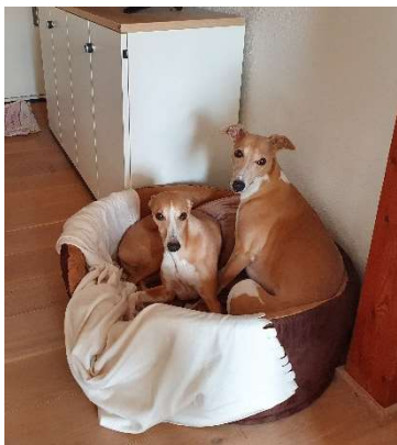
Betriebsklimabeauftragte: Bella & Kaja

Themen auf dem kurzen Dienstweg und ohne Termine besprochen werden.