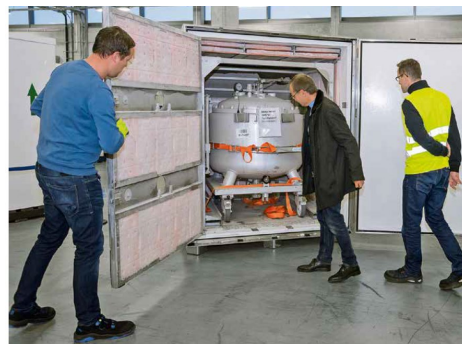
Morgens um 7 Uhr in Biberach: Das Team nimmt den Container gespannt in Empfang.

Das Pilotprojekt für den Test ist erfolgreich umgesetzt und es folgt die Implementierung der Transportlösung zwischen den Standorten.