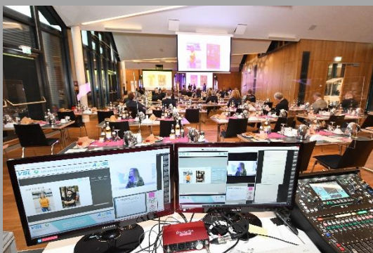
Abbildung 6: Hybride Veranstaltung