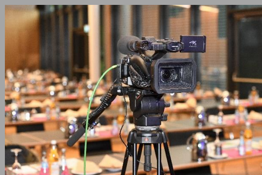
Abbildung 5: Kamera für hybride Veranstaltung