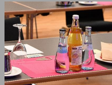
Abbildung 3: Papiertischsets

In der Gastronomie setzen wir hochwertige und umweltfreundliche Papiertischsets ein, welche die Plastiktischsets in unserem Sortiment komplett abgelöst haben. Da das Papier bereits recycelt und zusätzlich biologisch abbaubar ist, sind die neuen Tischsets deutlich vorteilhafter für unsere Umwelt. Sofern diese nicht verschmutzt sind, vermeiden wir die Einmalverwendung und Müllentstehung und setzen die Tischsets auch gerne mehrmals ein.