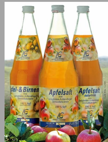
Abbildung 7: LE-Apfelsaft

Die FOLDERHALLE bezieht ausschließlich Apfelsäfte und Apfelschorle von dem kommunalen Apfelsaftproduzenten. Durch unseren Neubau und die damit einhergehende Kapazitätserweiterung ist der Apfelsaftverbrauch gestiegen. Im Berichtszeitraum liegt der finanzielle Aufwand bei ca. 1.000 €. Es erfolgte im Berichtsjahr 2019 die Patenschaft für ein Grundstück auf dem in den folgenden Jahren Apfelbäume gepflanzt werden sollen. Die Patenschaft für dieses Grundstück ist kostenlos.