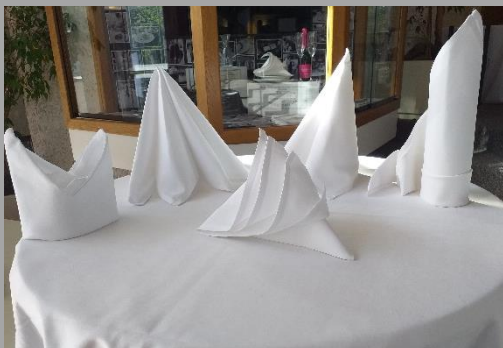
Abbildung 4: Stoffservietten, Tischdecken

Bei Privaten- und Businessveranstaltungen, werden bevorzugt weiße Stoffservietten auf den Tischen eingesetzt, welche anschließend in eine regionale Wäscherei gegeben werden. Die benutzten Servietten und Tischdecken werden gesammelt und erst bei einer größeren Menge zur Wäscherei gefahren.