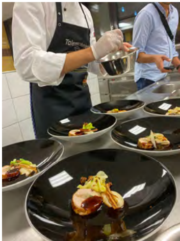
Bild Anrichten von Fingerfood bei der Talentschmide

Der VKD Landesverband veranstaltet jedes Jahr ein Camp für seine herangehende Köchinnen und Köche wo diese die Möglichkeit haben ihr junges Talent insbesondere im Bereich Fingerfood zu präsentieren. 2022 konnte 17 auszubildende Köchinnen und Köche wieder diese Fortbildung ermöglicht werden und Dank zahlreicher Unterstützung ermöglicht werden.