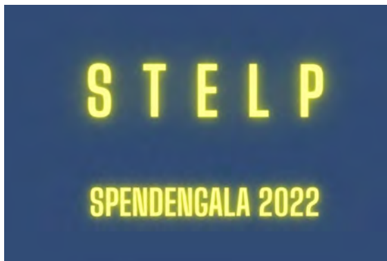
Bild Spendengala STELP

In der Mediathek von regio tv ist ein kurzer Einblick möglich