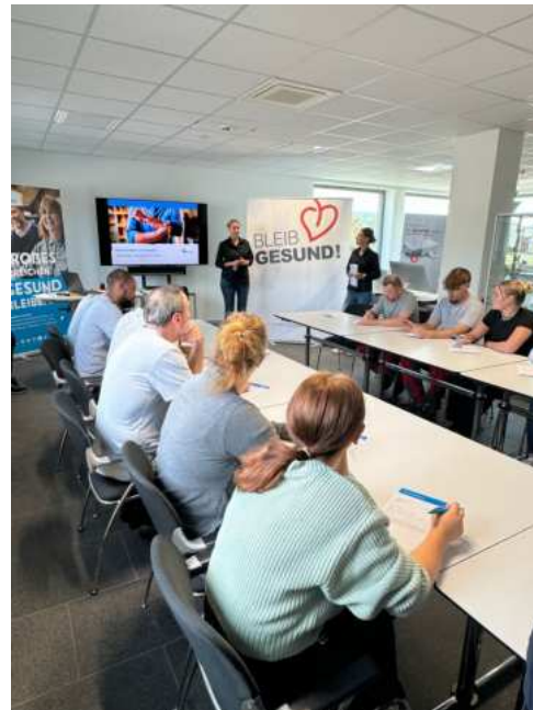
„Bleib gesund“ Workshop zum Thema „gesunde Ernährung“