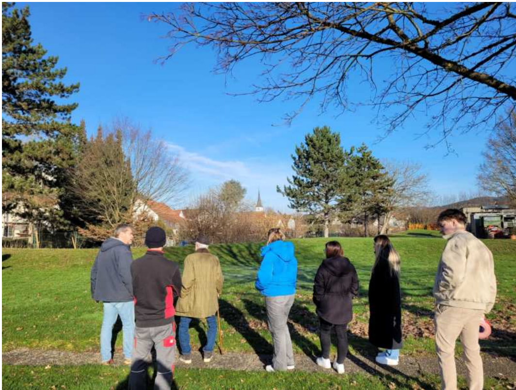
Ortsbegehung und Lokalisierung geeigneter Nistplätze