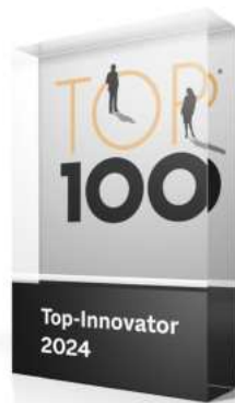
Auszeichnung TOP 100