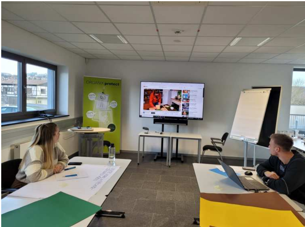
Recherche-Arbeit zum Thema Nisthilfen