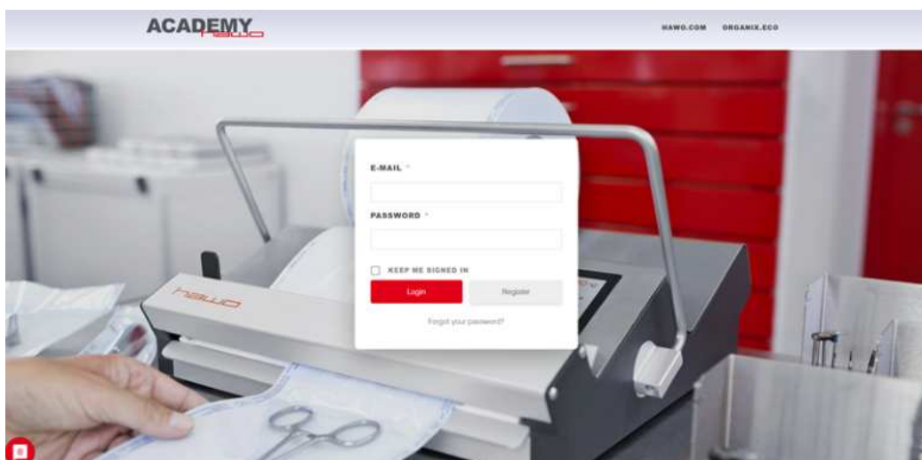
Anmeldemaske hawo Academy