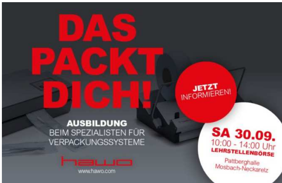
Social Media Kampagne Lehrstellenbörse

Im kaufmännischen Bereich durften wir uns über zwei neue Auszubildende freuen, die ihre Ausbildung im September 2023 bei hawo starteten. Im gewerblichen Bereich konnten wir leider keine neuen Ausbildungsplätze für den Ausbildungsstart 2023 besetzen. Durch verstärkte Teilnahme auf Ausbildungsbörsen und Kooperation mit regionalen Schulen konnten wir jedoch für 2024 auch in diesem Bereich zwei Auszubildende für hawo begeistern.