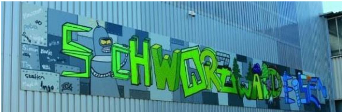
Abbildung: Graffiti an der Hallenwand – bei einer Teamaktion von den Mitarbeitern erstellt