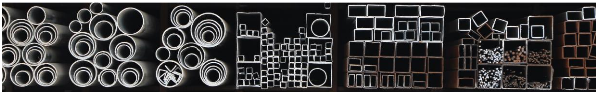
Abbildung: Teil des Stahlsortiments der Firma Schwarzwald Eisenhandel GmbH & Co. KG

Heute betreibt die SchwarzwaldEisen Gruppe im Bereich Stahlgroßhandel mit der Firma Schwarzwald Eisenhandel GmbH & Co. KG (im Folgenden auch „Schwarzwald Eisen“) vier Standorte in Baden und mit der Firma Westerwaldstahl GmbH drei Standorte in Rheinland-Pfalz. Die Schwarzwald Eisen Gruppe hat sich im Bereich Stahl zum Ziel gesetzt mithilfe einer Mehrstandortsstrategie, die regionale Marktführerschaft in beiden Wirtschaftsregionen nachhaltig und profitabel zu behaupten und auszubauen.