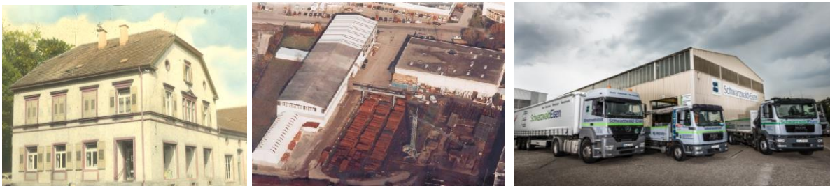
Abbildung: Eisenwarengeschäft "Auer" in Zell am Harmersbach (rechts), Hauptsitz nach dem Umzug ins Lahrer Industriegebiet West (mitte), Schwarzwald Eisen im Jahr 2021 (links)