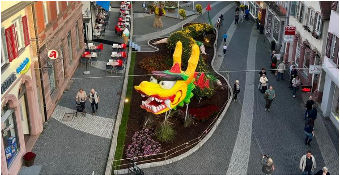
Abbildung: Drache aus Chrysanthemen von der Unternehmensgemeinschaft Lahr gesponsert