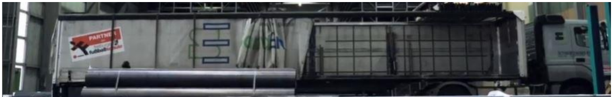
Abbildung: „Partner der Freiburger Fußballschule“

Die Schwarzwald Eisenhandel GmbH & Co. KG ist seit 2018 offizieller Partner der Freiburger Fußballschule und unterstützt somit die Fußballtalente aus der Region auf ihrem Weg zu einer potentiellen Profikarriere.